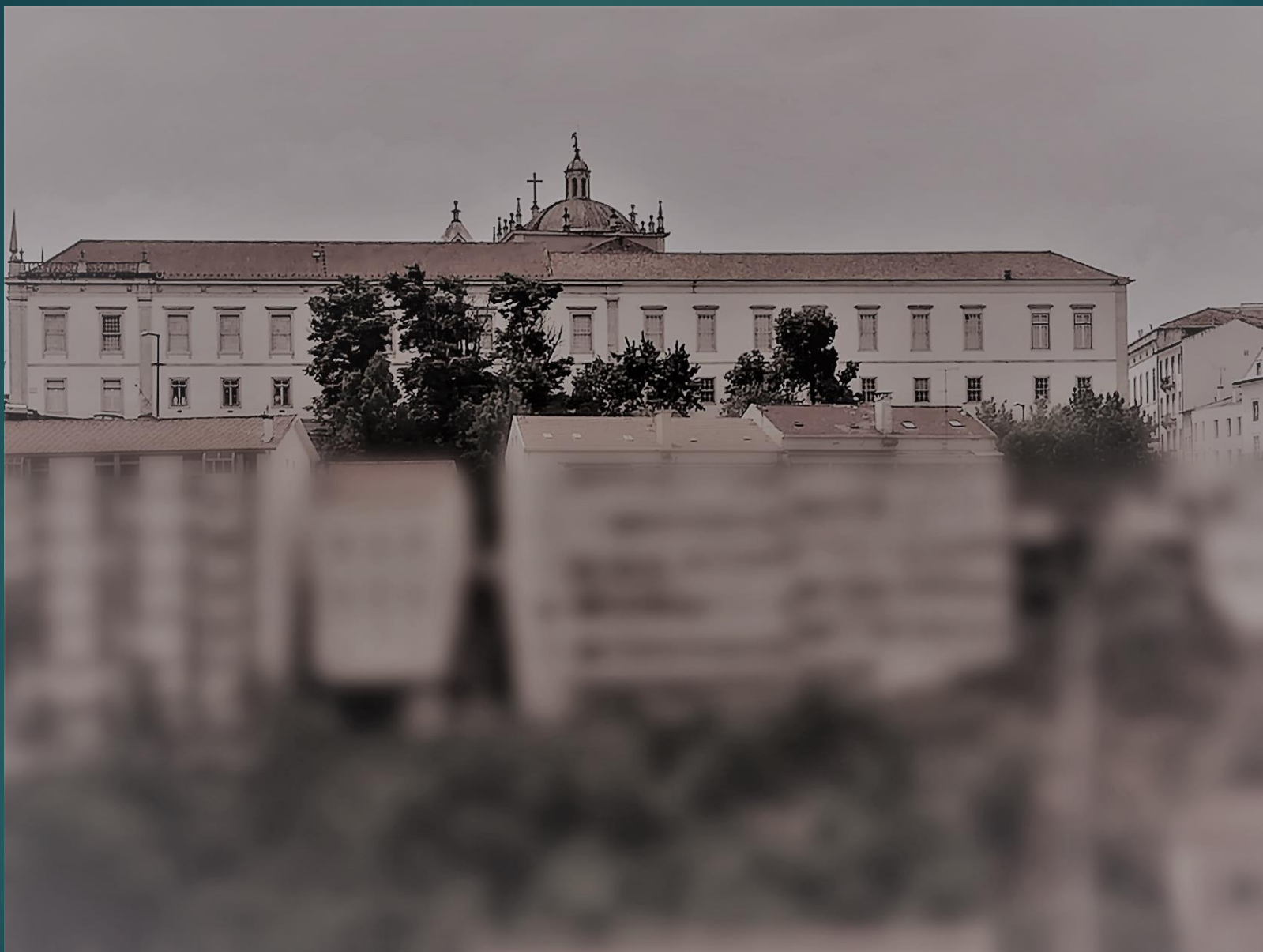
VISTA: Sé Nova de Coimbra