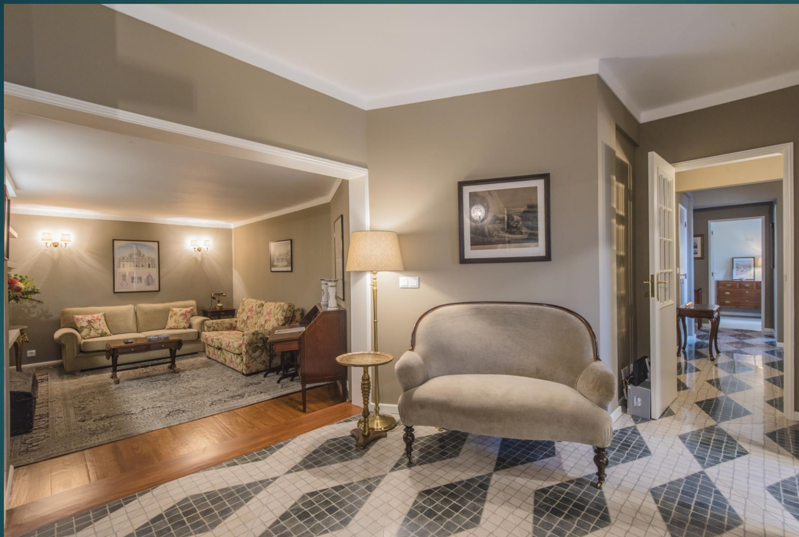
R. Guerra Junqueiro 31, cave posterior 3000-207 - Coimbra